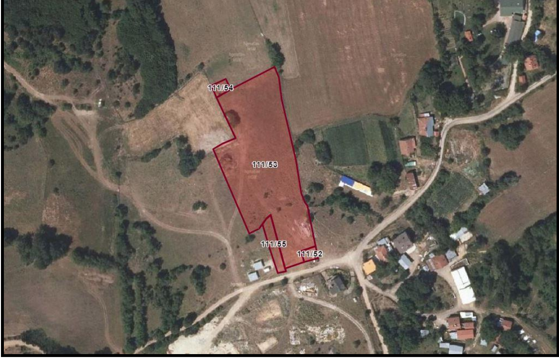
Planlama Alanı Uydu Görüntüsü

Planlama Alanı, Bolu ili, Merkez ilçesi, Gövem köyü, tapunun 111 ada, 52,53,54 parselleri kapsamaktadır. Parseller üzerinde herhangi bir yapılaşma bulunmamaktadır.