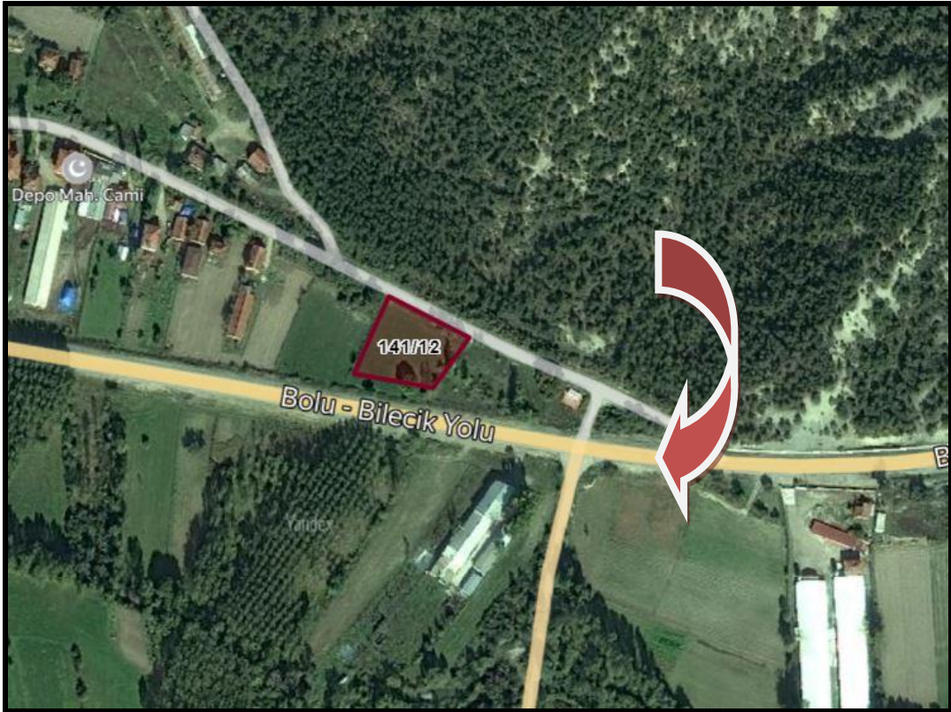
Planlama Alanı Ulaşım Krokisi

3-Planlama Alanı Ulaşım: Planlama alanı Bolu İli, Göynük İlçesi, İbrahimözü Köyü sınırları içerisinde bulunmakta olup; ulaşımı Bolu- Bilecik Yolu üzerinden sağlanmaktadır.