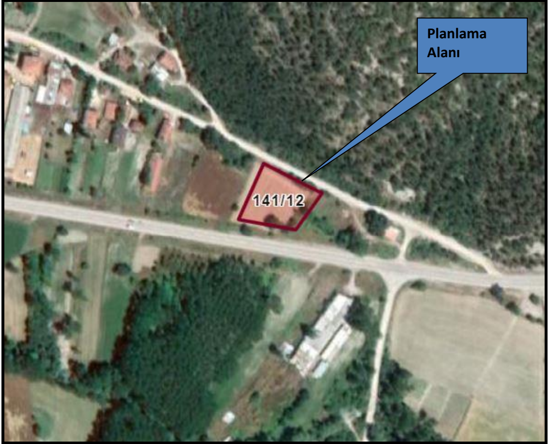
Planlama Alanı Uydu Görüntüsü

1-Planlama Alanının Yeri: Bolu ili, Göynük ilçesi, İbrahimözü Köyü, tapunun 141 ada, 12 parsel numarasında kayıtlı gayrimenkuldür. Yüzölçümü 1.899,00m 2 'dir.