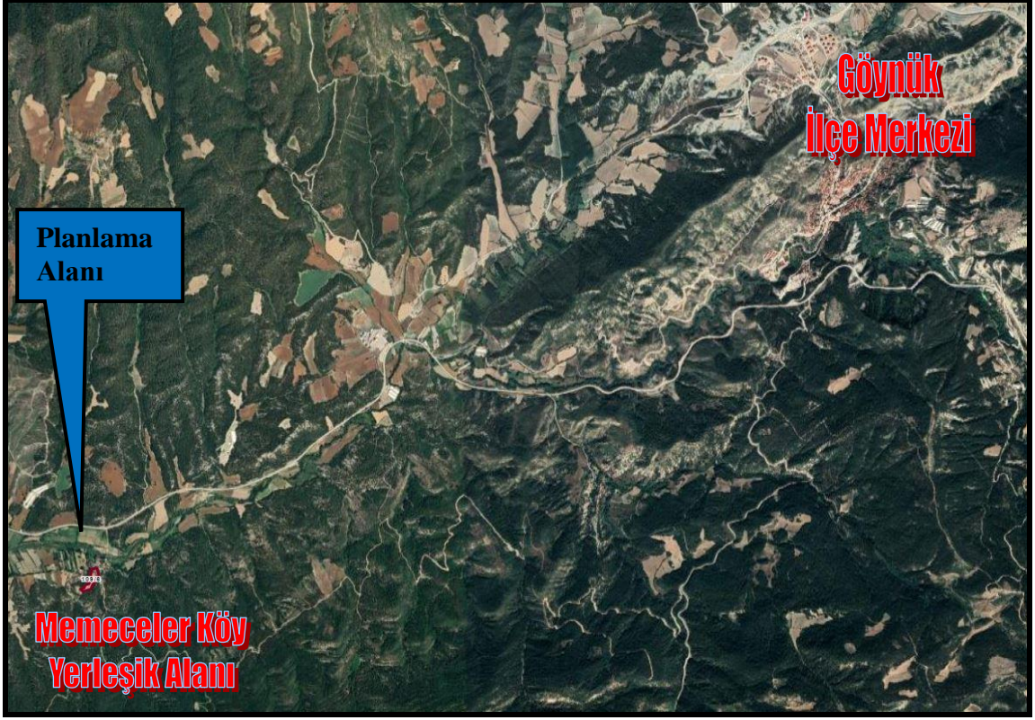
Planlama Alanı Konum Krokisi

2-Plan Hazırlanması Amacı: Konut Alanı amaçlı yapılaşmaya gidilmesidir.