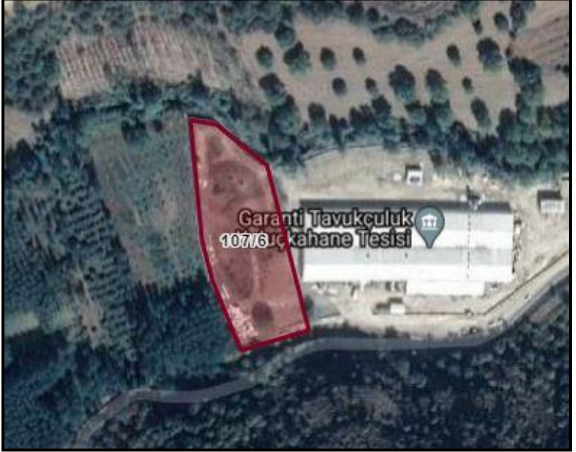
Planlama Alanı Uydu Görüntüsü

Planlama Alanı: Bolu ili, Mudurnu ilçesi, Çavuşderesi Köyü, tapunun 107 ada, 6 parsel numarasında kayıtlı gayrimenkuldür. Yüzölçümü 6.270,41 m 2 'dir.